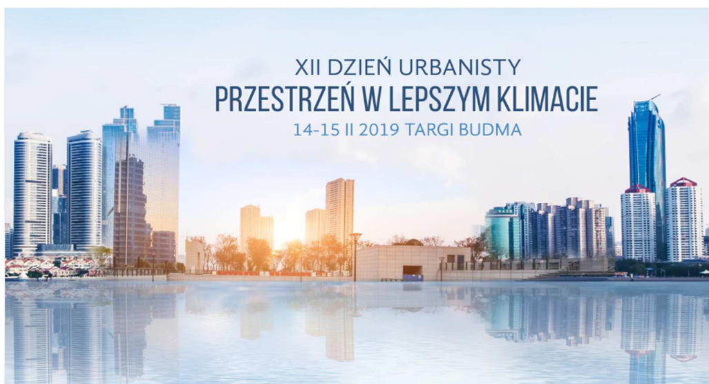
oprac. A. Leraczyk

XII edycja „Dnia Urbanisty” zatytułowana „Przestrzeń w lepszym klimacie” odbyła się w dniach 14-15 lutego 2019 r. na terenie Międzynarodowych Targów Poznańskich, jako jedna z imprez towarzyszących targom „Budma 2019”.